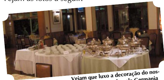
Vejam que luxo a decoração do nosso Jantar elaborado pela Germania