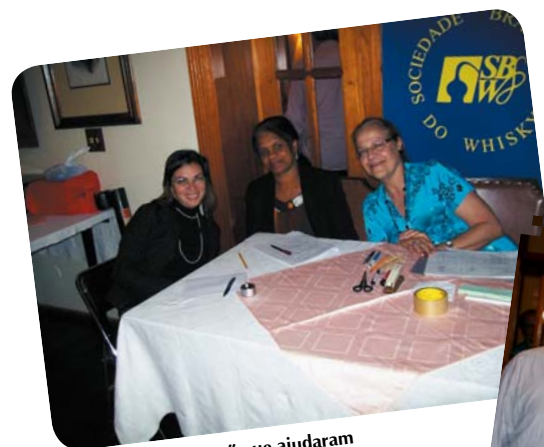
As três “meninas” que ajudaram no sucesso da festa