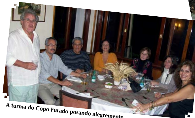
A turma do Copo Furado posando alegremente